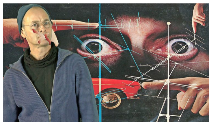
Die Pharmawelt und ihre Strategien in der Werbung sind Thema im Pharmaziemuseum. Foto: PD

Museum Kleines Klingental, Unterer Rheinweg 26. Rote Shuttle-Linie oder Tram 6, 8, 14, 15 und Bus 31, 34, 38 bis Rheingasse.