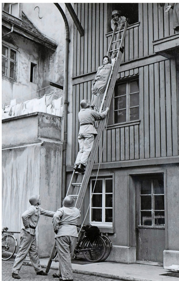
Im Feuerwehrmuseum ist zu sehen, wie die Feuerwehrleute vor hundert Jahren gearbeitet haben.

Grün spielen im städtischen Leben eine wichtige Rolle. Auch in der Museumsnacht dreht sich im Museum Kleines Klingental alles rund um die Sonderausstellung «Bäume in Basel. Das Grün im urbanen Wandel». Im Angebot hat es Kurzführungen, Diskussionen, Textbeiträge und Lesungen über Bäume, über Baumschatten und