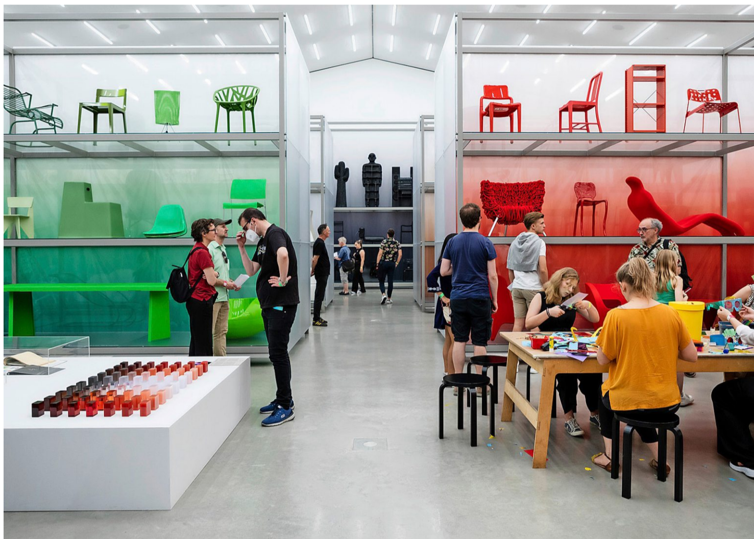
Das Vitra Design Museum zeigt die Ausstellung «Hello, Robot. Design zwischen Mensch und Maschine».

In Parkanlagen, am Rheinbord, in Privatgärten, ja selbst in Strassenamen – Bäume und urbanes